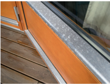
Afbeelding 1 Corrosiepokken op aluminium glaslatten toegepast in de buurt van de kust.

sieproducten meer ruimte innemen. In afbeelding 1 ziet men van zulke witachtige pokken. Deze zijn ontstaan op niet-geanodiseerde aluminium glaslatten van kozijnen in een maritiem milieu. Het zal duidelijk zijn dat de corrosieve belasting te hoog is geweest en dat komt vooral door de vorming van aerosolen. De aluminiumoxidehuid bezwijkt dan plaatselijk en anodiseren had dit fenomeen sterk afge-remd of zelfs geheel voorkomen.