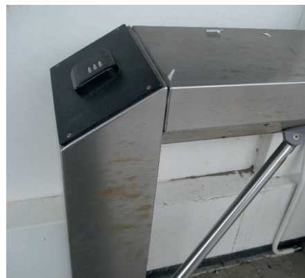
Afbeelding 3 RVS 316-toegangspoort dat aangetast is door aerosolen.

Dit fenomeen is ook bekend bij roestvast staal en op afbeelding 3 ziet men een toegangspoort van roestvast staal 316 in de buurt van de kust. Duidelijk zijn roestplekken die in dit geval ook wel theeplekken worden genoemd.