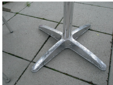
Afbeelding 2 Aangetaste aluminium poten van een terrastafel door aerosolen.

zeewater die door de wind worden meegenomen vanuit de zee en die tijdens hun vlucht indampen waardoor de zout- en chloridenconcentratie verder toenemen. Dit bewerkt voor het aluminium een grotere corrosieve belasting dan met gewoon zeewater. Het gevolg is plaatselijke aantasting van het aluminium waardoor er corrosiepokken ontstaan die soms ook tot putcorrosie kunnen leiden. Vooral op en in de buurt van de kuststreek en op jachten ziet men regelmatig onderdelen van aluminium die door deze inwerking (zelfs zwaar) aangetast zijn. Deze invloed kan zich laten gelden tot wel 15 kilometer vanuit de kustlijn. Op afbeelding 2 ziet men aangetaste aluminium poten van een terrastafel die in buurt van de kuststreek stonden opgesteld na slechts 4 jaar gebruik. Juist deze delen worden extra aangetast omdat de regen niet altijd gemakkelijk de opgedroogde zeezouten kan verwijderen omdat het tafelblad er nu eenmaal boven zit. Wel komt er vocht bij die de elektrolytische werking verder activeert maar het is dus te weinig om de zouten weg te spoelen. Daarom zal aluminium beter presteren indien regenwater het oppervlak regelmatig kan reinigen. Ook had men een betere bestendige kwaliteit moeten kiezen.