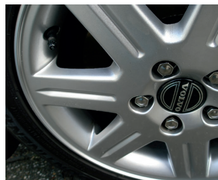
Afbeelding 12 Dezelfde velg maar na reiniging met de genoemde organische reiniger gevolgd door het opbrengen van een beschermlaagje op nanoschaal.