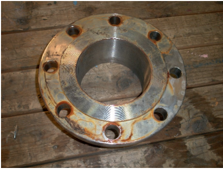
Afbeelding 4 RVS 304-flens die besmet is door ijzerhoudend water.