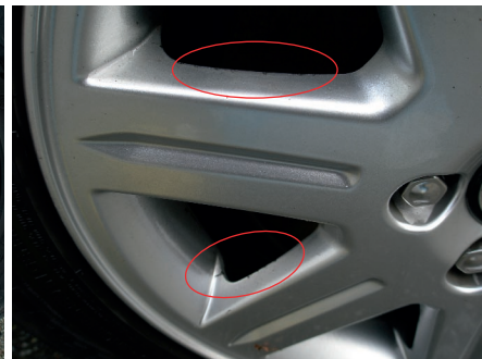
Afbeelding 11 De randen zijn aangetast door remstof en ander vuil (zie in de elipsen).