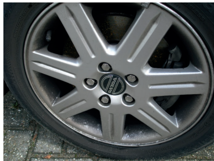
Afbeelding 10 Een vervuilde en aangetaste aluminium velg van een autowiel.