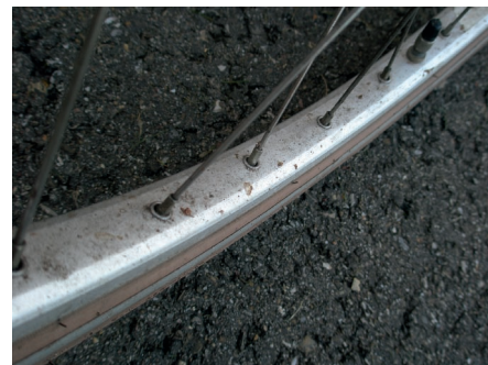
Afbeelding 8 Een aluminium fietswielvelg die door het gebruik zwaar vervuild en gecontamineerd is.

Dank is verschuldigd aan Alumatter, die relevante informatie heeft geleverd. ◀