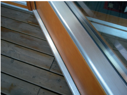
Afbeelding 6 Dezelfde glaslat als in afbeelding 1 echter na het verwijderen van de corrosie-pokken.