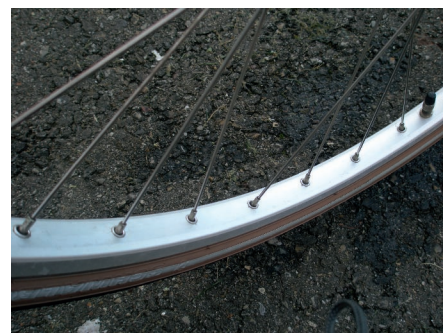
Afbeelding 9 Dezelfde velg maar nu gereinigd met Innosoft B570.